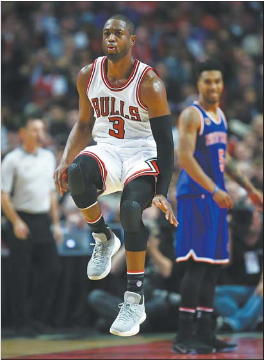
►韦德的小聪明被联盟禁止。

更衣室。训练结束后,他向克里坦顿挑衅道:“要不要来选一把?”紧接着,克里坦顿掏出自己准备的已经上膛的手枪对准了阿里纳斯。千钧一发之际,保安及时赶到并阻止了事态进一步恶化。