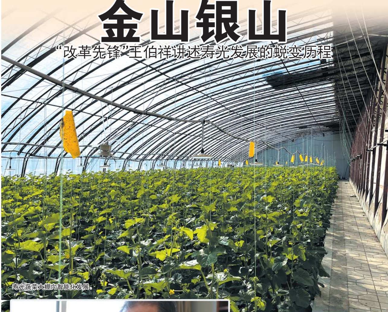
寿光蔬菜大棚向智能化发展。