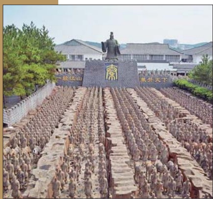
安徽省安庆市太湖县的水泥制“兵马俑”。