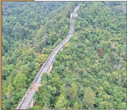
江西南昌溪霞怪石岭生态公园景区的观光长廊景点。