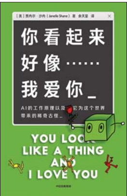
《你看起来好像……我爱你》 [美]贾内尔·沙内 著 余天呈 译 鸚鵡螺 | 中信出版集团

这是一本写给普通人了解AI的趣味科普书。作者贾内尔·沙内拥有一个电子工程专业博士学位以及一个物理学硕士学位,常写一些关于人工智能的文章,比如人工智能可以做什么、不能做什么以及它为什么已经影响了我们生活的方方面面,这些有趣又好玩的话题,正符合我们当下对于人工智能的好奇与探索。“通常人们声称的人工智能所做的工作,实际上都是人类居于幕后在工作。作为这个星球上的消费者和公民,我们得避免上当受骗。我们需要理解我们的数据是如何被人工智能使用的,理解我们使用的人工智能究竟是什么。”