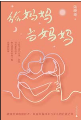
《给妈妈当妈妈》 陆晓娅 著 新民说 | 广西师范大学出版社

认知症是认知和记忆退化方面的疾病,阿尔茨海默病是认知症最为常见的亚种。在妈妈得了认知症,并逐步发展到中期之后,陆晓娅选择了正式“退休”,陪护并记录下妈妈度过人生的最后一段时光,35篇短章集成了这本《给妈妈当妈妈》。作者并没有把照顾母亲看成一场悲情的漫长告别,而是在这个过程中,与母亲重建了全新的沟通方式和母女关系,“我特别不希望‘后浪’完全牺牲自己来照顾‘前浪’。人类应该是一代人带着一代人往前走,相互扶持。”