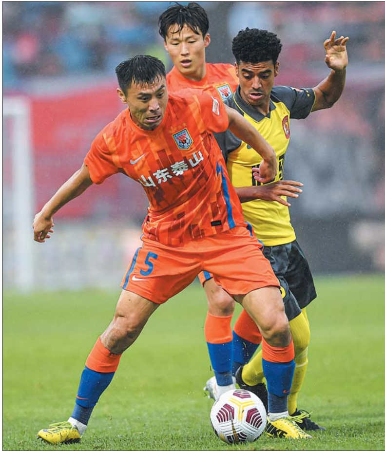
上一轮泰山队绝杀广州队让球队士气大振,期待本轮一鼓作气争取三分。

另外,作为老牌中超球队,河南队从不是一个可以“掉以轻心”的对手。尤其是在主场对战泰山队上,河南嵩山龙门似乎格外得心应手。数据来看,虽然泰山队整体胜场占优,但从2015年开始河南嵩山龙门曾连续3年在主场战胜泰山队,2019年同样如此。泰山队的队员们仍需要全力以赴,拿下河南再取胜利。