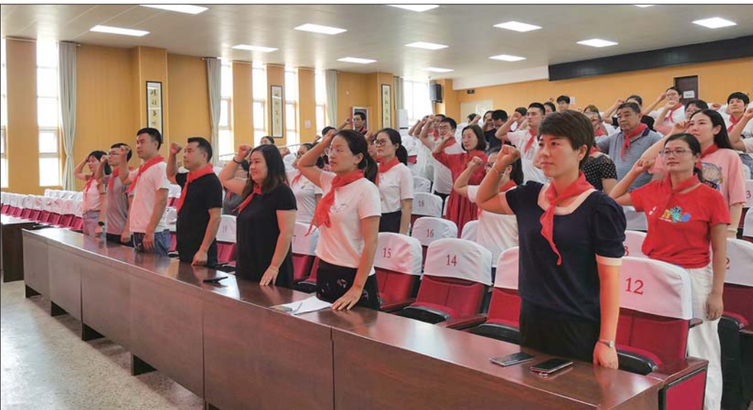
嘉祥县金屯镇中心小学青年教师团队。

嘉祥县金屯镇中心小学始建于1951年，是一所文化底蕴深厚的农村小学。学校先后被授予国家级国学经典联盟校、山东省语言文字规范化学校、山东省素质教育实验学校、山东省重大教育科研课题实验学校、山东省农村小学教学工作先进单位、济宁市规范化学校、济宁市少先队工作示范校、济宁市文明校园等荣誉称号。 一直以来，学校坚持立德树人根本任务，关注青年教师的成长，充分发挥青年教师的特长，点燃了他们的工作热情，形成了积极向上的校风，打造了一支爱岗敬业、品德高尚、崇尚和谐、追求卓越、充满活力、具有创新精神的青年教师队伍。