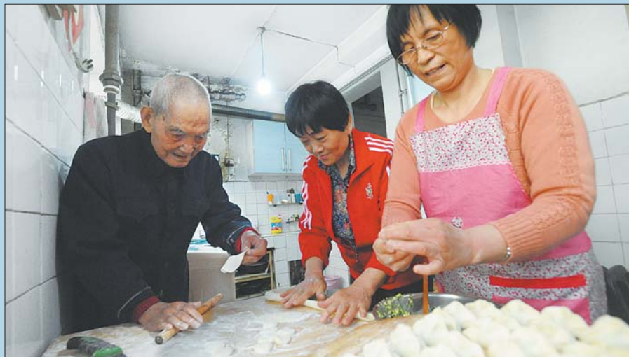
闺女、儿媳包饺子时，老人高兴了还能搭把手擀水饺皮。