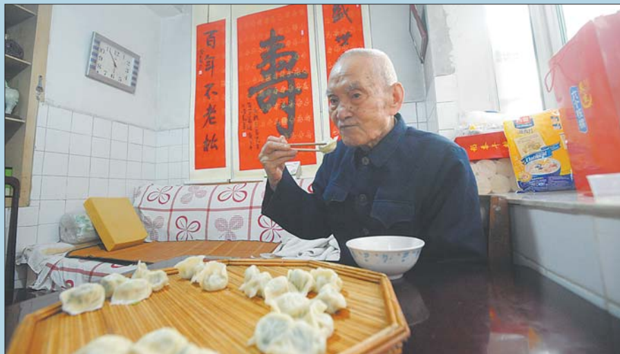
老人早餐西红柿鸡蛋面、中午蒸包、晚饭水饺，十几年几乎没有变过。