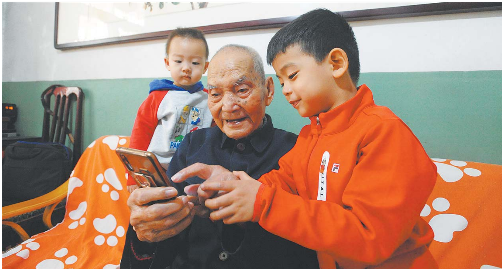
老人和重外孙玩手机。