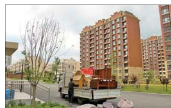
回迁群众正在忙着搬家。

走进安置小区,小区内配套设施完善,地下停车库、绿化景观、健身场所等生活配套项目一应俱全,环境宜人,生态宜居。已经拿到钥匙的群众表示:“新家采光好,楼间距大,非常感谢党和政府的好政策,能搬进这么好的房子。”此次老四中周边交房共涉及