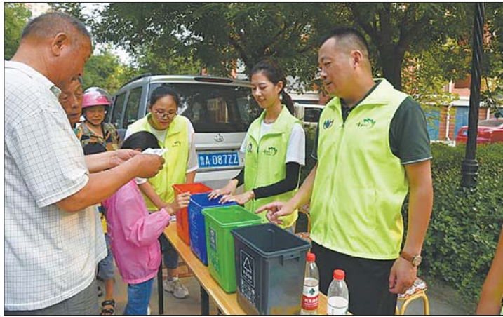
130余名志愿者分成10个小分队,深入城市乡村、社区村庄宣传垃圾分类。

济南市章丘区自2018年6月开展垃圾分类工作以来,经过不断摸索实践,确定了“末端处理倒逼前端分类”的总基调、总思路,以及“基层党建引领、党政机关先行、试点村居立标、示范片区铺路”的示范创建工作布局。通过压实主体责任、强化设施建设、高频督导检查、广泛宣传发动等措施,全力打造垃圾分类工作的“先行区”和“桥头堡”,并取得显著成效。