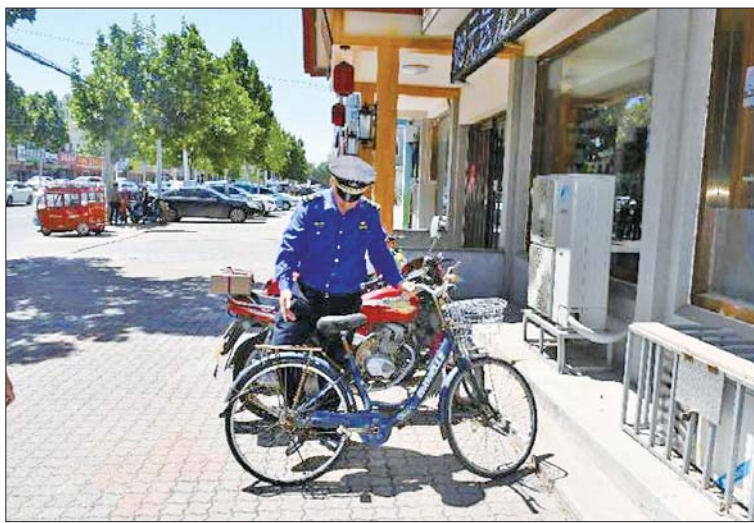
规范非机动车停放。

南市城市市容管理条例》,对占道经营、店外经营、店外乱摆乱放、随意晾晒、违法广告牌匾等乱象,挨家挨户对沿街商铺进行对标整治。督导责令3家汽修商铺,4家五金机电商铺对破坏市容行为进行整改。