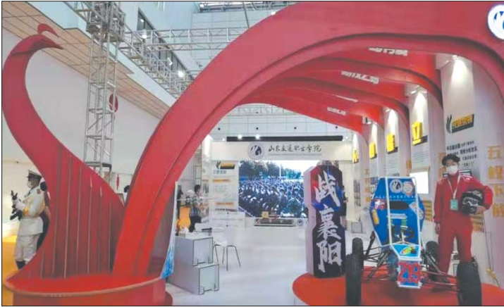
职业教育博览会上的山东交通职业学院展区

山东交通职业学院带来飞机、赛车,山东畜牧兽医职业学院的宠物狗成了展会明星,山东信息职业技术学院的新一代信息技术也是展会上的亮点……在此次博览会上,山东职业教育的“特色”愈加突出。 “专业聚‘交’,围绕交通,打造陆、海、空、轨、车、物流的专业体系,学校的专业群只有六个,但学校的目标是在专业化的路上办出特色。”山东交通职业学院院长王心介绍,在2020年,因为买了一架大飞机,学校成为网红,购买大飞机也反映了学校专心布局交通行业,把专业建成精品的决心。 在山东畜牧兽医职业学院的展台前,除了一个个动物标本,几只活泼可爱的宠物狗成了展会上的小明星,在一众双高院校中,这个充满生气的展台别具特色。“学校的畜牧兽医专业群是教育部公布的高水平专业群建设点,学校的专业不多,但在全国的高职院校中,学校的畜牧特点突出,独树