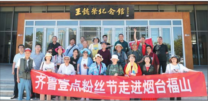
6月5日,壹粉们在王懿荣纪念馆前合影留念。