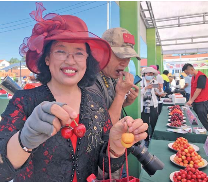
6月5日,壹粉们来到烟台大樱桃节现场采风。

在期盼中,烟台漫山遍野的大樱桃红了。为了让壹粉们品尝正宗的烟台福山大樱桃,6月4日—5日,“探福地 品春果”——齐鲁壹点走进福山粉丝节启动,30余位壹粉来到烟台市福山区,品尝正宗的烟台大樱桃,感受福山文化底蕴,开启了一场两天一晚的福地文化探秘之旅。