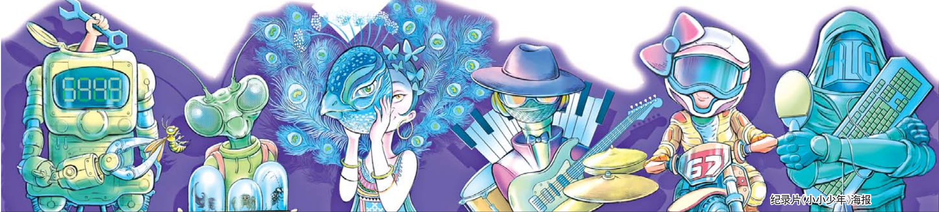
纪录片《小小少年》海报

精神的丰富内涵。在刚刚取得全面胜利的脱贫攻坚战中,就涌现出了无数可歌可泣的感人故事。《摆脱贫困》就让不少观众为此流下热泪,八年的脱贫攻坚之旅浓缩成8集脱贫攻坚专题片,“一代人有一代人的长征,一代人有一代人的担当”的感悟源于该片强大的艺术感染力。“事非经过不知难”,有观众评价,看完这部纪录片,年轻人会更了解中国之伟大。作为12部入围作品中唯一一部直击并记录新冠疫情的纪录片,《金银潭实拍80天》留下的不仅是中国故事,更是世界故事。片中主角们的痛苦与欣慰,人性的纯真与挣扎,都令人动容,难以忘怀。无论是历史还是当下,最终都要走向未来。《小小少年》记录下那些“痴迷”于自然、科技、艺术、运动等不同领域的天才少年和他们与众不同的成长故事——这些追求自己心中梦想,爆发出勇敢、执着、顽强、忘我状态的后浪们,每一个都可能在未来大有可为。