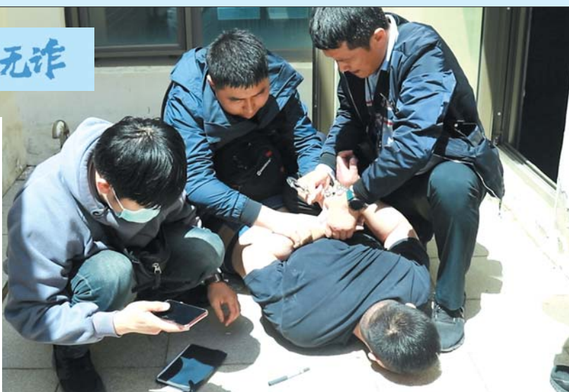
民警抓获洗钱团伙嫌疑人。警方供图