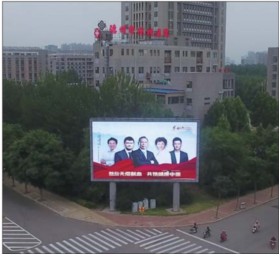
德州多个大屏播放公益宣传短片。