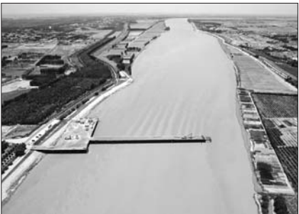
东津黄河大桥施工现场

德州路西延暨东津黄河大桥工程属于东营市“一环两快四横四纵”的区域干线公路网布局规划中“四横”之一的重要支撑线路,起点位于德州路与郝纯路交叉点,沿规划德州路向西展线,于利津县小李庄村北新建黄河大桥跨越黄河,后继续向西至荣乌高速连接线,计划建设工期36个月。项目建成后,将成为东营中心城区连接东吕高速的快捷通道,有利于加速完善山东省公路交通网络,缓解跨黄河交通压力,加快黄河三角洲高效生态经济区、山东半岛蓝色经济区的开发建设。