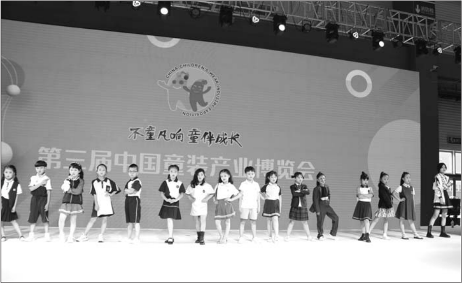
少儿模特身着漂亮的校服出现在T型台

作为第三届中国童装产业博览会的重要组成部分,2021山东省首届校服高峰论坛于6月18日-20日在青岛国际博览中心成功举办。本次论坛是由山东省纺织服装行业协会和齐鲁晚报·齐鲁壹点共同主办,来自省内的校服专家、优秀校服企业代表、区县教育局相关负责人、中小学校校长近百人参加了此次论坛。