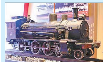
中国第一台蒸汽机车“八一”号的模型