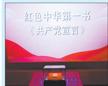
主题展上展出的《共产党宣言》。