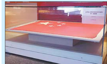
山东省人民政府成立时升起的第一面国旗(1949年10月)。