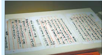
主题展上展出的邓恩铭家信(1925年)。