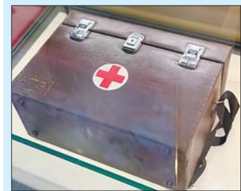
孔繁森用过的药箱。