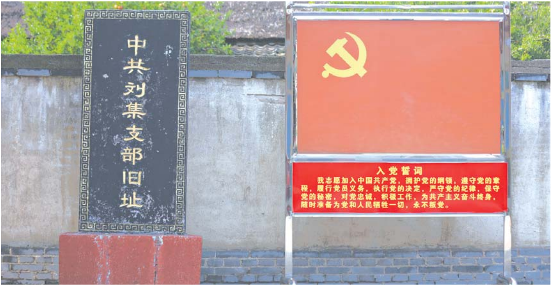
中共刘集支部旧址