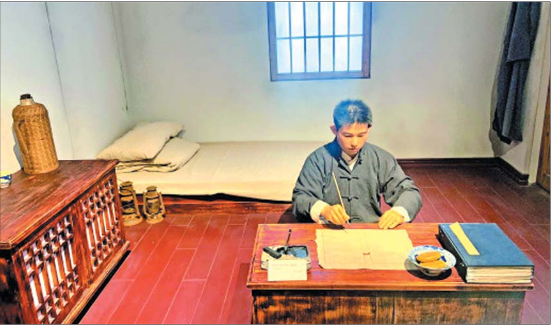
中共青岛党史纪念馆内复原的邓恩铭工作场景。