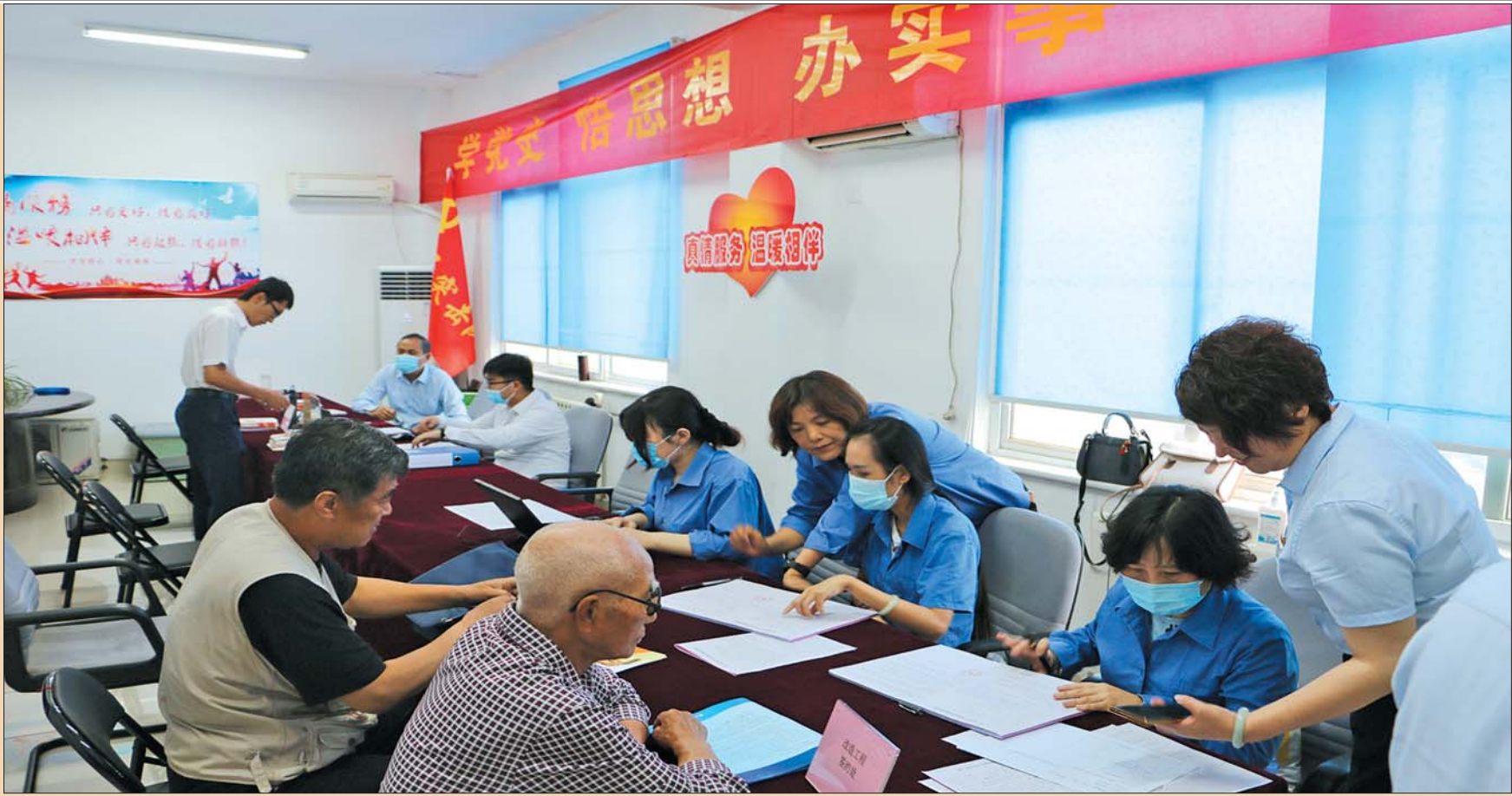
党员突击队入社区服务,将「零跑腿」落到实处。