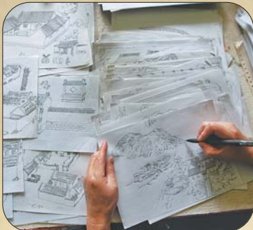
河流、人物、船只、农田等素材的手稿，杨勇画了近千幅。