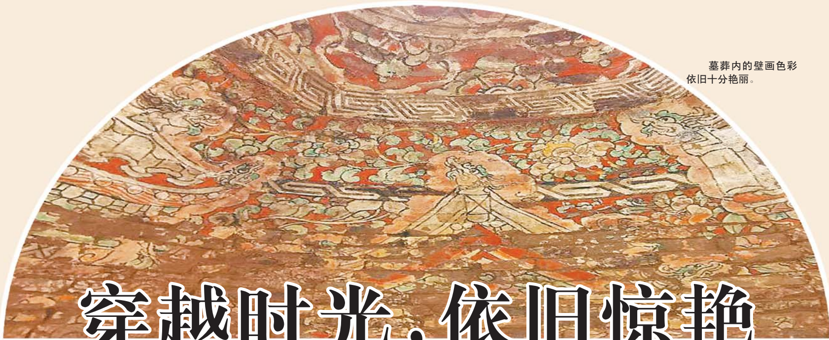
墓葬内的壁画色彩依旧十分艳丽。