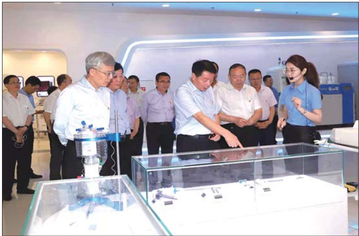
鲁东大学党委理论学习中心组赴胶东(威海)党性教育基地开展“学史崇德”现场教学。

健全落实“两双”党建项目的督查与考核机制。 学校党委把“双认领”“双服务”党建项目纳入巩