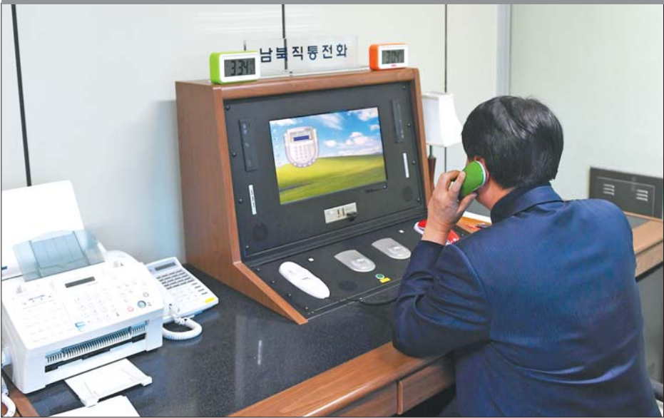
2018年1月3日,在朝鲜半岛中部的板门店,韩方工作人员通过朝韩联络热线与朝方联系。