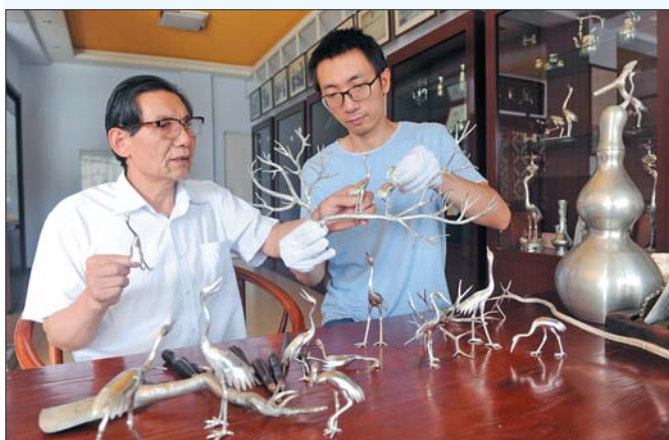
父子两人对作品反复仔细推敲。