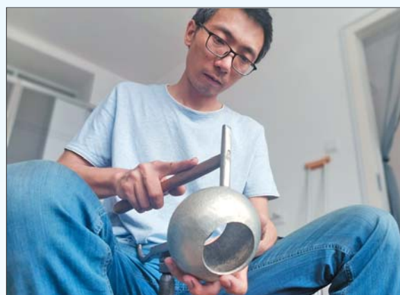
一把锡壶要敲打两三万下才能成形。