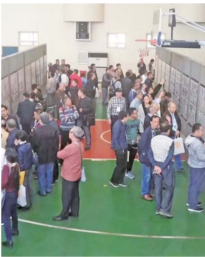
2018年举行的齐鲁集邮研究会成立20周年纪念暨第九届集邮文化节。