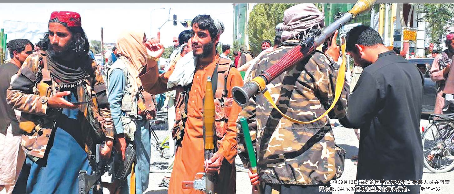
这张8月12日拍摄的照片显示塔利班武装人员在阿富汗东部加兹尼省首府加兹尼市街头行走。