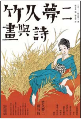
《竹久梦二:画与诗》 [日]竹久梦二 著 陈子善 选编 林少华 译 领读文化 | 天津人民出版社

《竹久梦二的画与诗》是学者陈子善选编的梦二作品集。首章《春之卷》收录的是当年令丰子恺一见倾心的作品。流水般的线条简洁生动,足见人物神韵。寻常的人和事,不是一帧帧定格的相片,能照出微妙的情感,令观者会心。《搂在一起就不会淋湿了》乍看最像丰子恺作品,以孩童为题材,不着眉眼却已点出神情的功力令人赞叹,拙朴的片假名写就的文字如星星点点的雨滴,颇有童趣,隔着书页都能闻得笑语,那是任尔东西南北风都觉快乐的童年。《往日旅馆信一封》以极简的笔墨勾出女子半身像,凝神掩袖、欲语还休,“附有一枝玉兰花”的题词透出岁月的幽香。《结婚前夕——致妹妹》中悉心拣选嫁妆的女子面前寥落的商品和犹疑的姿态、《忘掉吧,忘掉长夜的梦》中附身在破碎信箋中的女子望不到的神情;《旅人之家》中倚门远眺所见的景致,皆在留白中蕴藏故事,观者的想象增添了观画的趣味。梦二笔下的未尽空间不是他设下的谜题,或可视为作者本人时常在进行的小游戏。他怀着诗心生活,一边在挖掘身边的细节,一边也