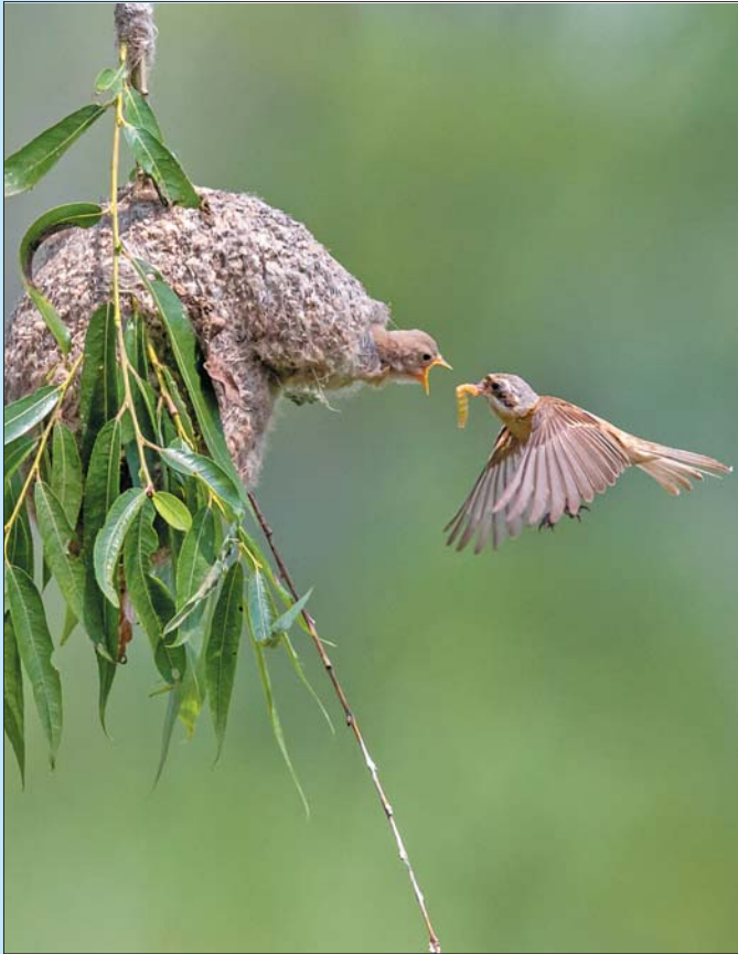
中华攀雀育雏。 摄于潍坊