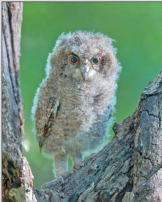
萌萌的领角鸮宝宝 摄于青州