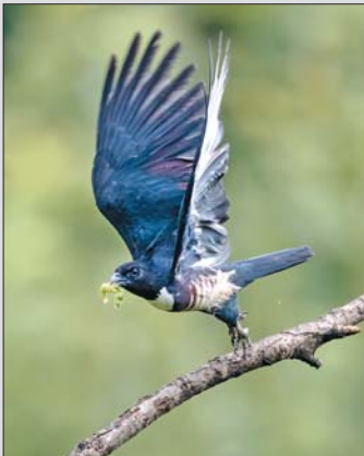
黑冠鹃隼 摄于董寨