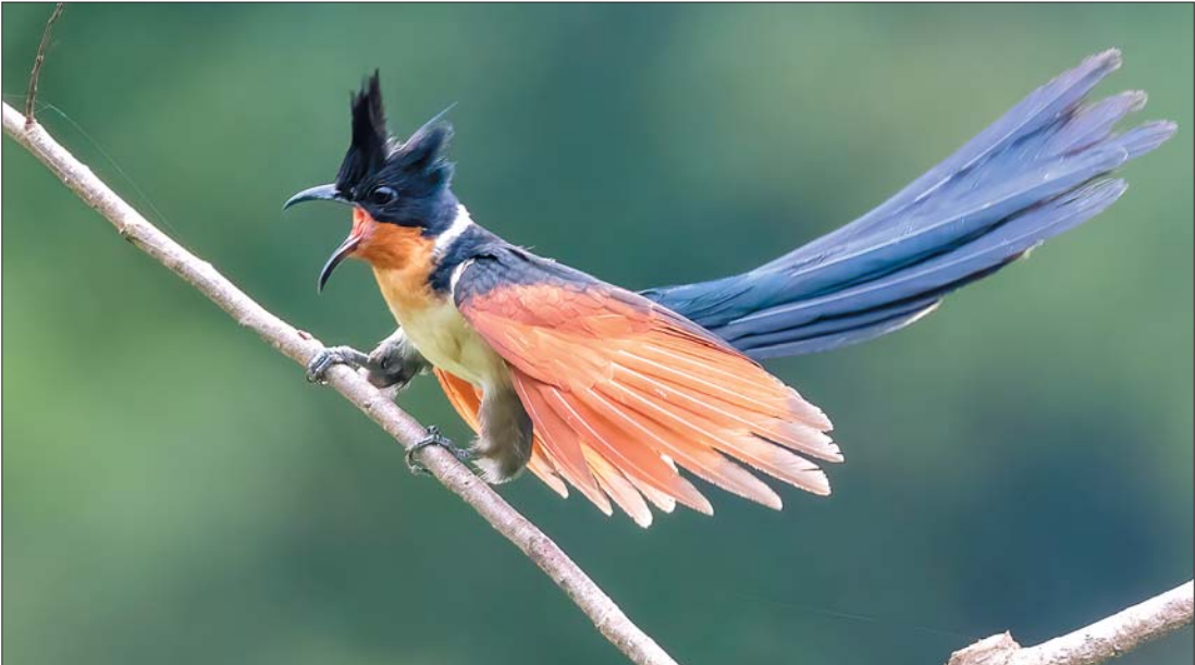
红翅凤头鹃 摄于董寨