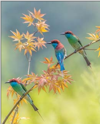
蓝喉蜂虎 摄于七里坪