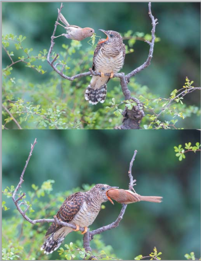
棕头鸦雀喂杜鹃。 摄于青州