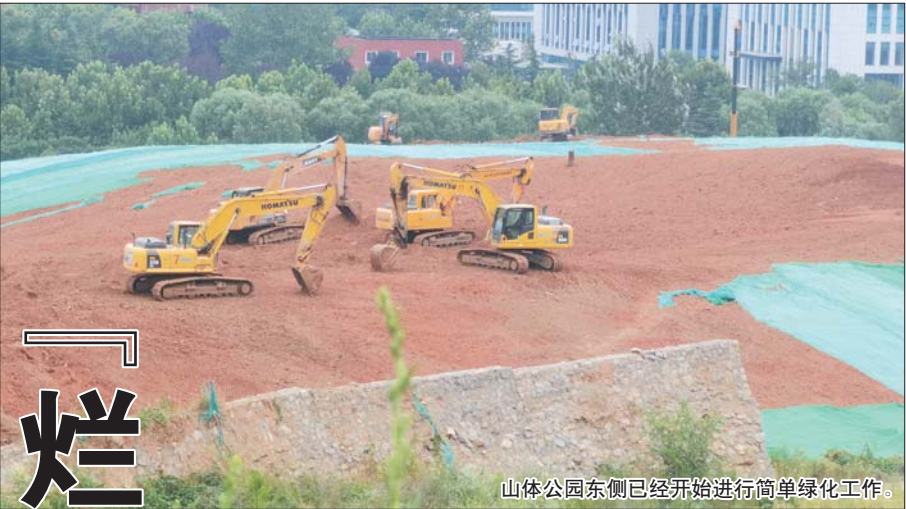
山体公园东侧已经开始进行简单绿化工作。