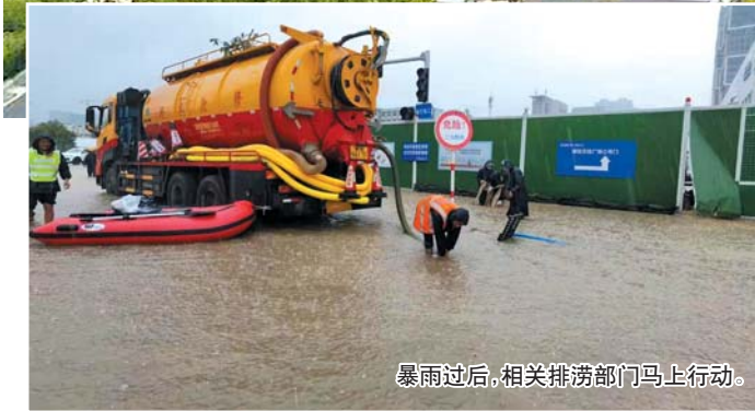
暴雨过后，相关排涝部门马上行动。