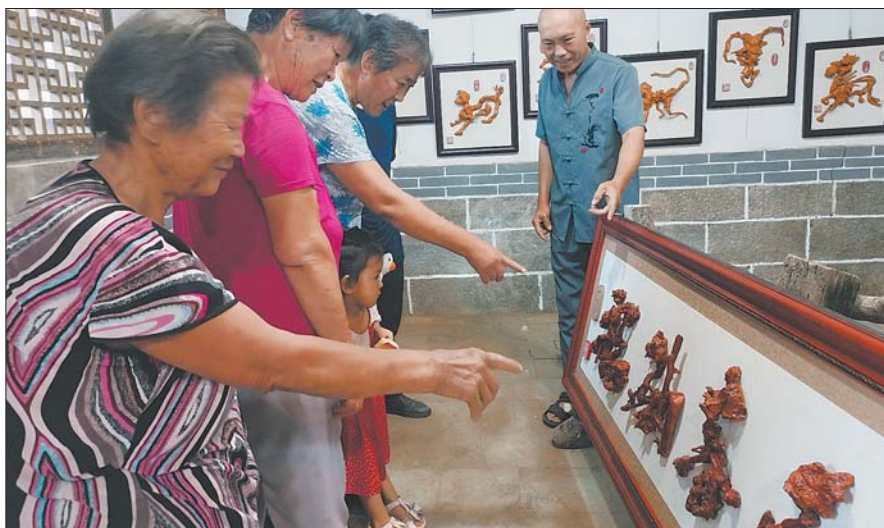
村民和游客不时来到已建好的根艺馆参观。