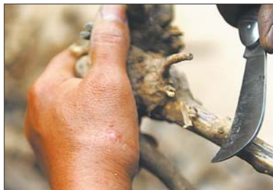
手上的伤疤清晰可见。