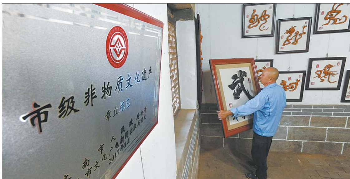
章丘根艺成为非遗。