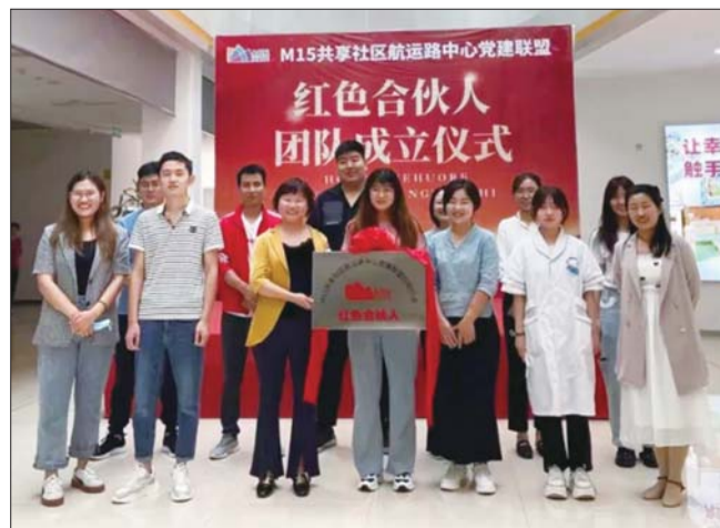
红色合伙人团队成立仪式现场。

目前,新区发挥“党建+”高效聚能优势,推动M15共享社区航运路中心党建联盟建设,依托社区党群服务中心有序开展“红色合伙人”“红领启智”“红领助行”“红领使能”“红领社会组织”等“红领行动”,努力打造布局合理、业态齐全、功能完善、智慧便捷、服务优质、商居和谐、高效便民的15分钟生活圈、党建圈,全面提升新区居民生活满意度和幸福感。