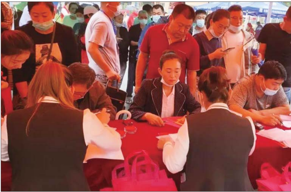
居民正在办理选房手续。

连日来,太白湖新区许庄街道京杭佳苑社区廉庄片区(济宁北湖省级旅游度假区东北片区棚户区改造2#地块5-17号楼项目)回迁上房,老百姓得偿所愿住新房,锣鼓喧天迎新居。截至目前,共有500多户业主陆续乔迁新居。京杭佳苑社区廉庄片区是太白湖新区重点民生工程,也是济宁市棚户区改造的重要组成部分。项目完成13栋,回迁户数1220户,建筑面积约21万平方米。