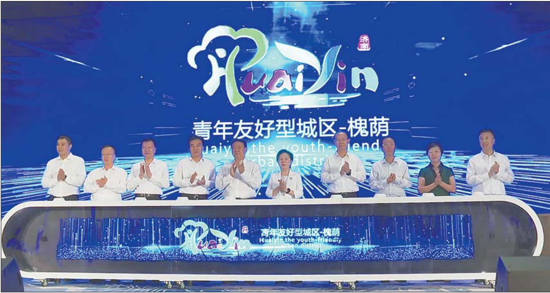
槐荫区正式启动创建青年友好型城区。

借助黄河重大国家战略、强省会战略和济南国际医学科学中心、央企总部城市建设强劲东风,槐荫正驶入高质量发展快车道。槐荫区将积极对标北京、上海等先进城市,构建集青年思想引导体系、青年发展政策体系、青年综合服务体系、青年建功体系于一体的“槐荫与青年共同成长”城市发展生态,全力打造“齐鲁门户、医养之都”,打造全省乃至全国青年发展示范区,为全区高质量发展凝聚青年力量。