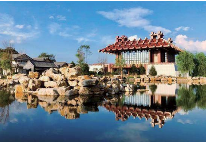
中国驿·泉城饮食文化小镇

让人仿佛置身欧洲城堡。 欧乐堡温泉酒店以温泉养生为特色，酒店独具一格的特色服务属温泉养生中心，让人在消除疲劳的同时，更有一份惬意的享受。 孔雀王蓝海御华温泉酒店是以马来西亚风格为特色的温泉主题酒店，酒店拥有孔雀王温泉会馆、孔雀王中餐厅、金孔雀自助百汇、兰卡威烤肉坊、主题客房等。客房设有马来西亚、菲律宾、泰国、印尼、夜空主题房、森林主题房等不同风格的客房房型。室内外30余个温泉泡池不同温度、不同玩法给您带来全新的温泉体验。 也有一些游客，想要更好的体验当地的生活。民宿、农家乐成为首选。 借水兴旅，齐河县马集镇搞起了乡村游，精心打造起集特色民宿、观光、游园于一体的乡村旅游渔业风情村，打造“齐家渔火，沙岸村居”品牌。赵官镇、表白镇……优美的乡村风光，完善的基础设施，便利的交通条件，在齐河特色文旅小镇住上一晚也是不错的选择。 中秋节、国庆节还不知道去哪里，齐河是你的不二选择。