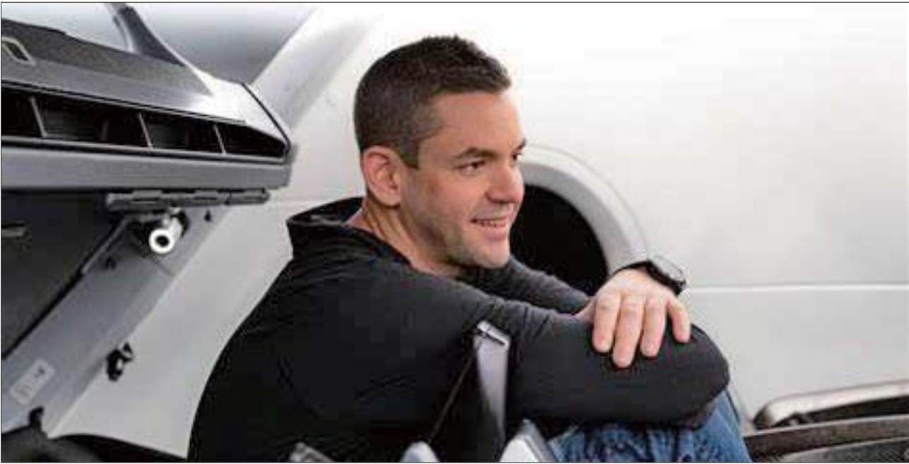
美国东部时间9月15日8时2分,美国太空探索技术公司(SpaceX)的“龙”飞船成功搭载4人飞上太空。这是一趟特殊旅行,因为4名乘客都不是专业宇航员,他们是第一个上太空的“全平民团队”。负责这次飞行的,是38岁的亿万富翁、企业家杰瑞德·艾萨克曼,他们在太空绕地球环行,将完成为期三天的商业太空旅行。