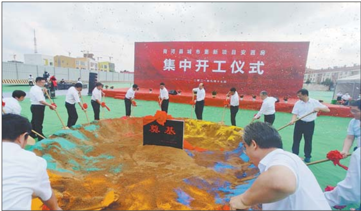
商河县城市更新项目安置房开工奠基仪式。