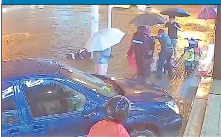
众人合力救出触电女孩。视频截图