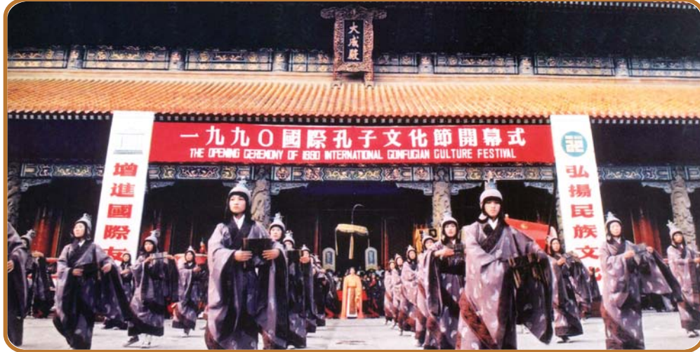
1990年首次演出仿古《箫韶》乐舞。