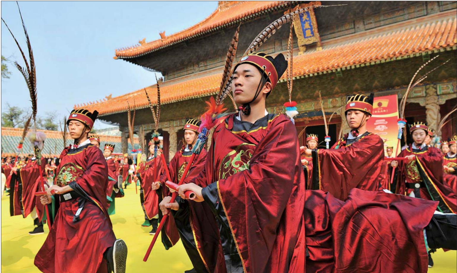
戊戌年公祭孔子大典。