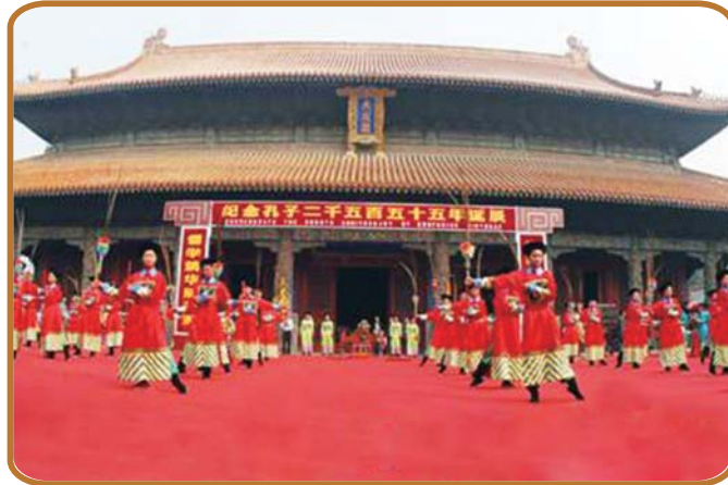
2004年首次恢复公祭孔子大典。