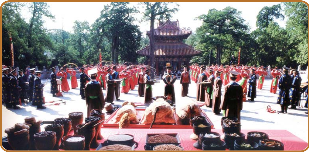
1986年首次推出仿古祭孔八佾舞。