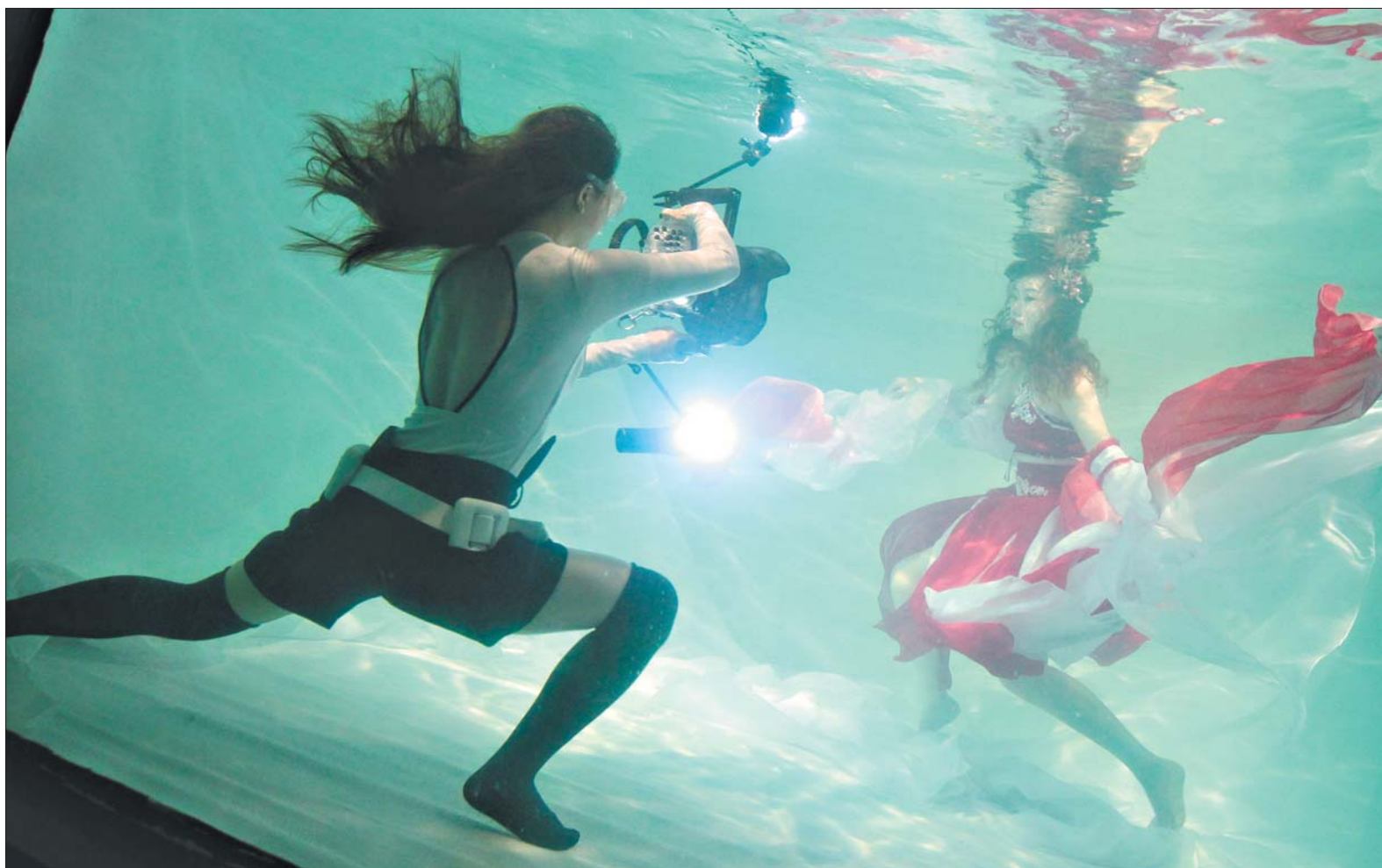
真真在水中为客户拍摄。