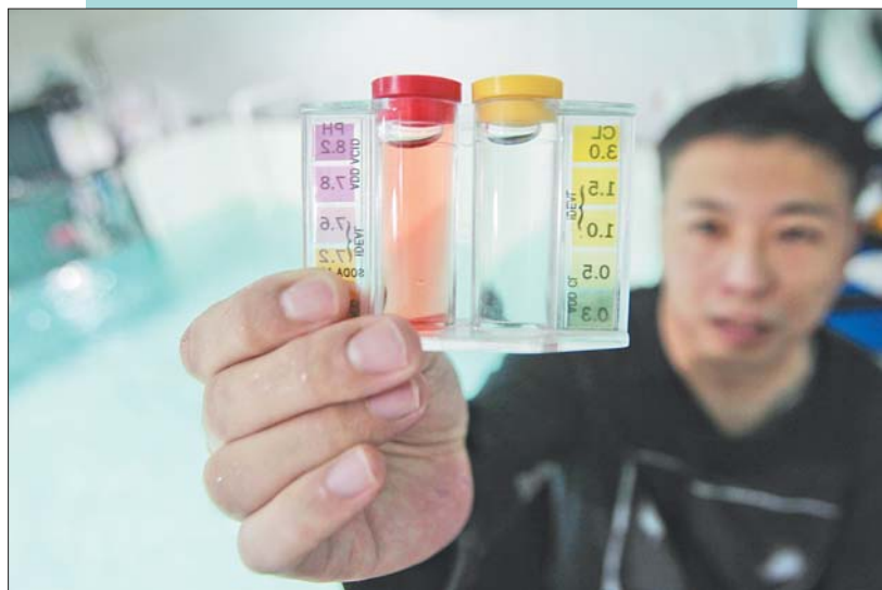
拍摄前，老高要下水取样，对水质进行监测。