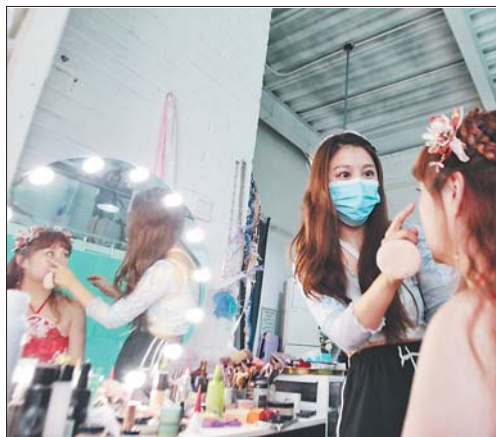
真真为顾客化妆做造型。