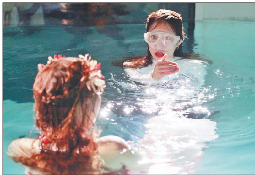
水中拍摄与地面不同，真真反复提醒顾客下水时的注意事项。

做设计图，定制水箱，请教专家水循环过滤，安装加热设备……今年5月，水下摄影正式开