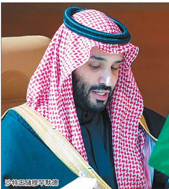
沙特王储穆罕默德

伊朗外交部发言人哈提卜扎德当地时间11日说,伊朗和沙特围绕双边和地区问题在伊拉克首都巴格达举行了四轮会谈,海湾和也门问题是会谈重点。分析人士指出,伊沙关系长期剑拔弩张,虽有改善迹象,消除紧张状态仍需更多努力。还有观点认为,伊沙关系改善进程可能要取决于目前尚待重启的伊核问题维也纳谈判。