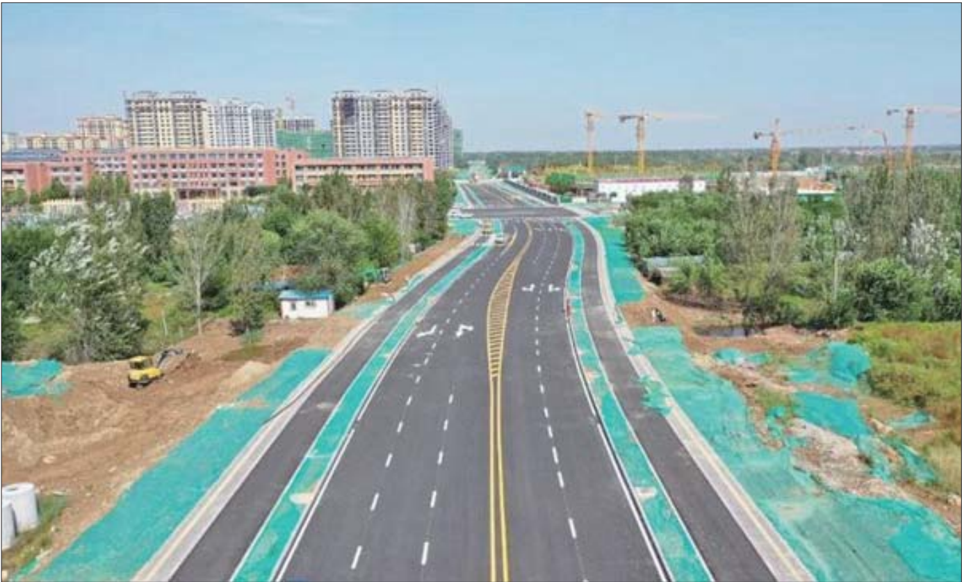
新建5条学校周边道路打通教育强县之路。

自2018年被命名为省级“四好农村路”示范县以来,商河县乘势而上,两级联创,今年6月,成为济南市唯一成功申报全国“四好农村路”示范县的县(区),目前已经完成网络申报,并通过线上评审。2021年,实施养护大中修182公里,