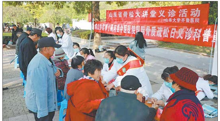
商河县中医医院举办国际骨质疏松日健康义诊活动。

本报10月31日讯(通讯员刘美森) 每年的10月20日是国际骨质疏松日2021年国际骨质疏松日中国主题——骨量早筛查,骨折早预防。10月19日,值此国际骨质疏松日之际,商河县中医医院外二科在医院党建办、办公室、工会、团委的支持下,在兄弟科室的热情协助下,成功在人民公园举办骨质疏松日大型义诊活动。