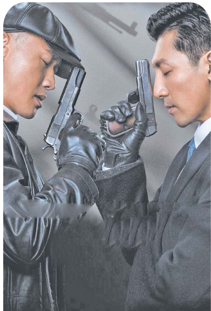
谍战剧《前行者》由张鲁一（右）和聂远这对中生代男演员搭档。

近两年的谍战剧，也出现了一些新气象：《隐秘而伟大》在市井化的基础上讲故事；《叛逆者》反“爽剧”套路，主角林楠笙没有大开主角光环，而是在谨小慎微