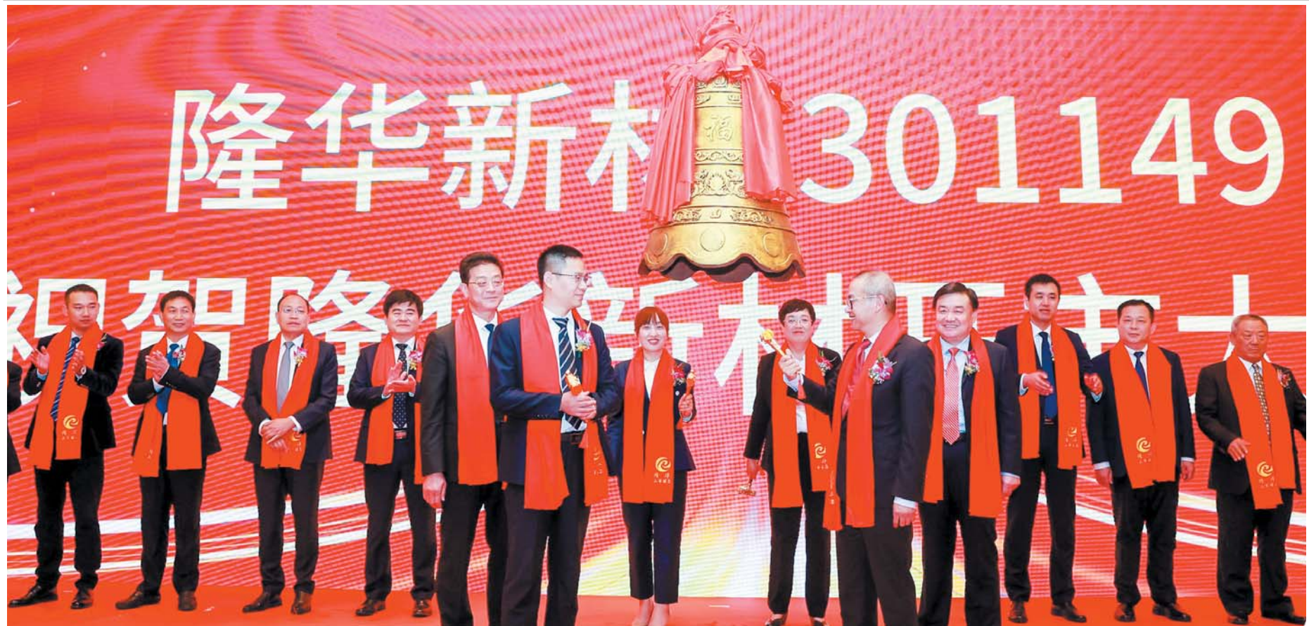
11月10日，隆华新材正式登陆创业板。就此，淄博成为全省首个A股上市公司县域全覆盖的城市。