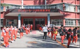
应急疏散演练 为增强师生的安全意识，近日，沂源县荆山路小学举行了“11.9”消防疏散演练活动。（唐刚 孙静）