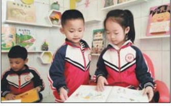
快乐阅读活动 为了营造浓厚的读书氛围，近日，沂源县荆山路幼儿园开展了“快乐阅读，快乐成长”的主题教育活动。（夏巧凤）