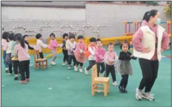
户外游戏活动 近日，沂源县荆山路幼儿园开展丰富多彩的户外游戏活动，进一步提高幼儿的运动能力。（夏巧凤）