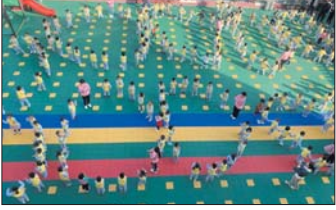
早操展示活动 近日，沂源县振兴路幼儿园举行了家长开放日活动，邀请家长们感受孩子在幼儿园的快乐。（刘虹 沈玉艳）