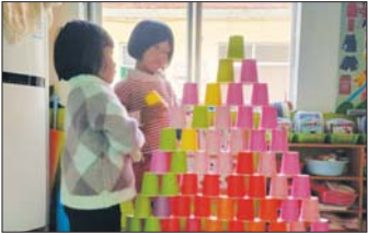
有趣的“纸杯游戏” 近日，沂源县悦庄镇赵庄幼儿园开展“有趣的纸杯游戏”区域活动。（郝目玲）

近日，沂源二中开展了“119”消防演练活动。此次消防疏散演练，随着警报声响起，老师引导学生沿着指定疏散通道快速撤离至安全地带。演练共用时2分零5秒，1000余名师生全部安全疏散完毕，整个过程紧张有序、实用性强，收到了预期效果。演练进一步增强了师生的安全意识，初步掌握了在危险环境中迅速逃生、自救、互救的基本方法。（刘念华）