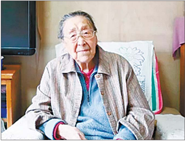
孔德懋晚年在家中接受记者采访。（资料片）