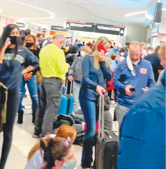
人们在发生枪支“意外走火”事件后离开哈茨菲尔德-杰克逊国际机场。(视频截图)

本报讯 当地时间20日,一名男性旅客在美国亚特兰大市的国际机场携带枪支过安检,枪突然“走火”,男子携枪逃跑。受惊旅客当下四散奔逃,导致这座多年获称“全球最繁忙机场”的航空枢纽暂停运营两小时。混乱中有3人受伤。警方已通缉该携枪男子,发现他犯过重罪,按律不得持有枪支。