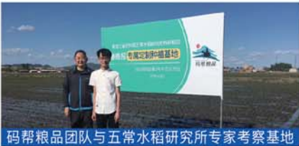
码帮粮品团队与五常水稻研究所专家考察基地

全球商品采购中心公布建立“银饭”标准,评选国产大米产区和品牌,民乐乡的稻花香大米成为首批入选的四家之一。