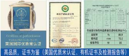
高品质,证书为鉴(美国优质米认证、有机证书及检测报告等)

经多方权威机构测评显示:码帮粮品五常大米不论是在口感、香气、营养元素、外观等都属于优质米。