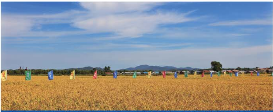
2021年码帮粮品自有800亩生态基地收割现场