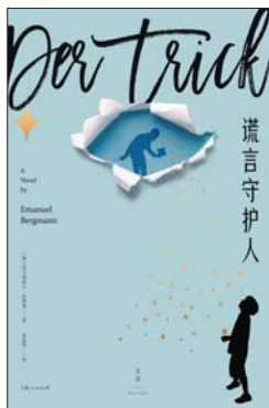
《谎言守护人》 [德]埃马努埃尔·伯格曼 著 景丽屏 译 世纪文景 | 上海人民出版社

庆山认为写作者在散文表达中通常一览无余,所有的生命体验都在敞开,与一切读者分享,而在小说中,这些私人化的部分则会被打散、隐藏,也因此,她保持着一种节奏——一本长篇小说出版之后,会将写作阶段的日记整理出版一本散文集。2002年开始,庆山陆续出版了记录个人行走、城市生活及情感的散文集《蔷薇岛屿》《清醒纪》《素年锦时》,2013年始开启新的散文阶段,更注重探索哲思与记录当下,从《眠空》《月童度河》到最新的作品《一切境》“以写作为工具,为道途,先帮助自己一程,再以自己的领悟帮助他人一程。”写作者的自由,是一种服务的自由,这也是《一切境》最终呈现出的底色。她以快速而直接的方式记录自己的生命体验,物质层面与精神层面都有涉及。这些被捕捉到的体验以碎片方式被收纳于书中,阅读者通过阅读自取所需。