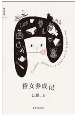
《俗女养成记》 江鹤 著 理想国 | 北京日报出版社

温情治愈系小说。20世纪初的布拉格,犹太男孩莫舍被楼上的锁匠带去魔术表演,爱上了舞台上漂浮在半空中的“波斯公主”。他追寻着马戏团步伐,丢弃自己的犹太人身份,假称为波斯王子扎巴提尼,开始在欧洲大陆辗转。而在21世纪的美国洛杉矶,小男孩马克斯因为奶奶成天念叨着死亡、集中营之类的事情而感到厌烦,更让他心烦的是父母打算离婚,他认为这是自己的过错,得知有一位名叫扎巴提尼的魔术师会用“爱的咒语”使人们重新相爱,便离家出走寻找扎巴提尼。而扎巴提尼此时已历经沧桑,穷困潦倒,玩世不恭,住进了一家养老院并准备自杀……魔术让怪老头和小男孩的命运相逢于一次荒唐的邂逅,他们建立起超越时间的友谊,也懂得了爱与生命的意义。