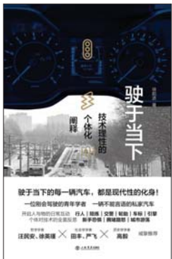
《驶于当下:技术理性的个体化阐释》 徐前进 著 上海书店出版社

除了两位医生,作者还采访周边数十人,并在旧报纸、老照片、建筑废墟与口述回忆中打捞过往生活图景,以工业城市、单位社会、稀缺经济、工人阶级文化、男性气概、重大历史事件和时代变迁等为经纬,呈现出兼具深度与广度的当代东北。通过个体在历史中的沉浮,我们看到的是一座城、一个时代的命运轮廓。