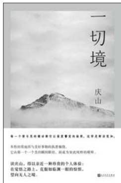
《一切境》 庆山 著 人民文学出版社